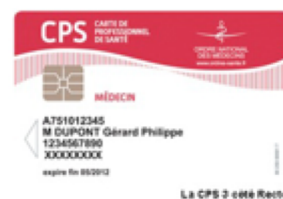
La CPS 3 côté Recto