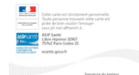
La CPS 3 côté Verso