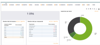
Tableau de bord de pilotage des patients symptomatiques du Covid-19 sur le territoire